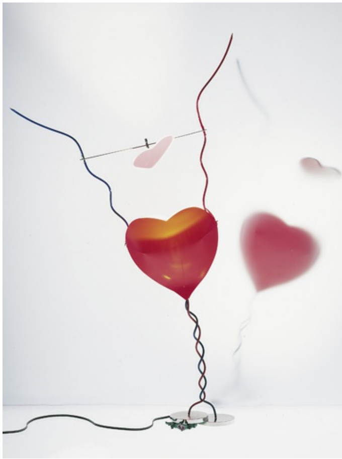
One From The Heart INGO MAURER 1989

Metallo, specchio orientabile in vetro e materiale sintetico.