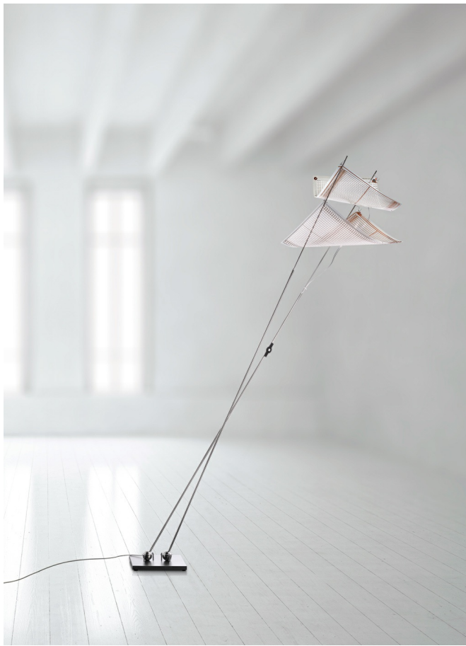
Dew Drops Floor INGO MAURER UND TEAM 2015

Les films plastiques ne sont plus disponibles. Par conséquent, Dew Drops est hors production. Film plastique transparent avec LEDs intégrés, métal. Les tiges sont montées grâce à une articulation à rotule sur la plaque (19 x 26 cm). Avec interrupteur à sensor tactile pour allumer et faire varier l'intensité de la lumière sur le film plastique. Dew Drops Floor est livrée avec un film plastique avec LED ou avec un film plastique avec LED plus une voile en papier comme diffuseur.