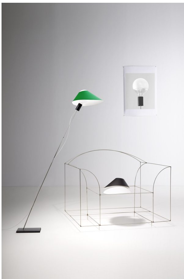
Glatzkopf Floor INGO MAURER UND TEAM 2017

Metall, Karton, Glas. Glatzkopf setzt auf Langbewährtes: ein Lampenschirm sitzt auf einem großen Glaskolben, der über Fassung und Stab in der Fußplatte fixiert ist. Doch ganz so schlicht, wie die Stehlampe auf den ersten Blick erscheinen mag, ist sie nicht: Der Lampenschirm erinnert durch seine asymmetrische Form an eine Kappe und verleiht der Gestalt eine gewisse Dynamik. In der Fußplatte sind drei Bohrungen, die den Stab in verschiedenen Winkeln fixieren. So kann der Nutzer die Neigung anpassen. Länge des Stabs variabel. Der Papierschirm lässt durch das Loch die Glühlampe sichtbar werden. Die Globe-Glühlampe selbst ist oben sandgestrahlt und innen mit LED-Strings ausgestattet.